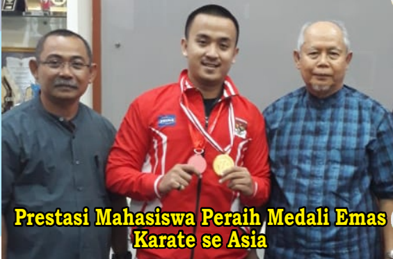
Prestasi Mahasiswa Peraih Medali Emas Karate se Asia