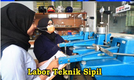
Labor Teknik Sipil