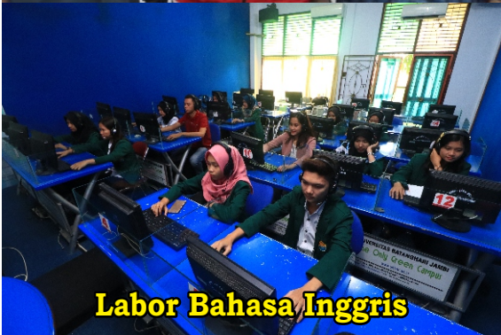
Labor Bahasa Inggris